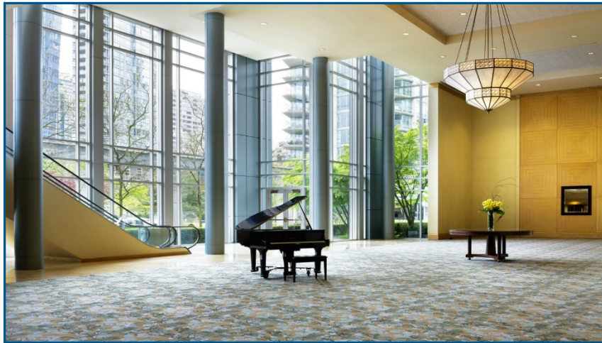
Le Grand Foyer de la Salle de bal du Bayshore, site des kiosques d'exposants et des pauses santé pendant le Congrès.

Le Congrès a lieu à l'hôtel Westin Bayshore de Vancouver. Les kiosques d'exposition seront situés dans le foyer attenant aux salles de présentation.